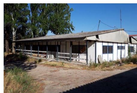
Albalate de Zorita

Rehabilitación de un edificio municipal para un espacio de Coworking