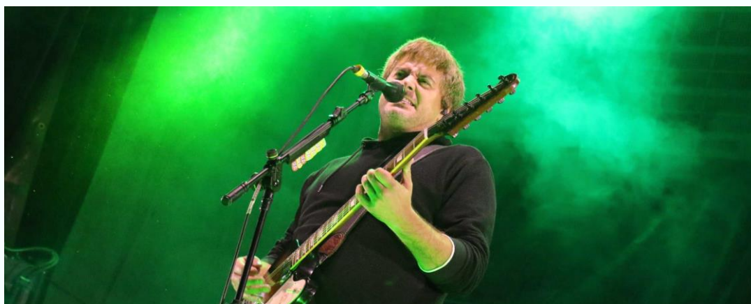
(Despistaos en Almonacid de Zorita)

Se ha lanzado el programa cultural Dinamiz-ARTj que genera una oferta cultural amplia en las ciudades y pueblos afectados por el cierre de minas de carbón, centrales térmicas y también centrales nucleares, tras acabar éstas su ciclo de vida. A menudo, en estas zonas el acceso a la cultura se ve dificultado por diferentes motivos – despoblación, crisis económica, envejecimiento de la población, falta de oferta cultural-. Por ello, el programa tiene el objetivo de fomentar la dinamización de la actividad cultural, apoyando a jóvenes artistas locales, favoreciendo las visitas a los municipios, complementándose así la oferta turística, además de colaborar con el desarrollo de una vida plena en los mismos porque la cultura es también un motivo para el arraigo al territorio de la población local.