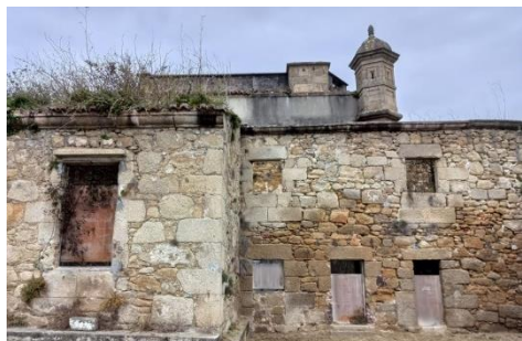
Valle de Altomira

Reforma de un edificio municipal para viviendas sociales