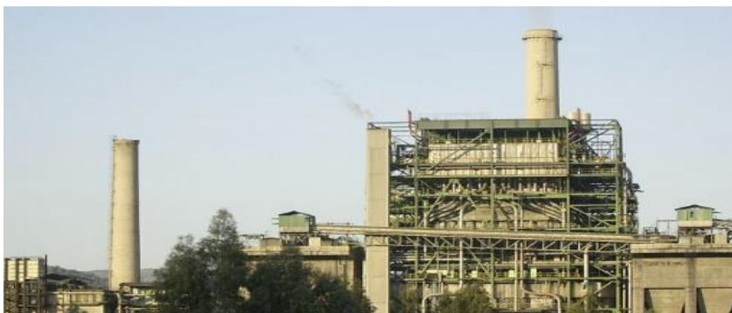
Central térmica de Puente Nuevo, en Espiel.

Dicho cierre tiene un impacto sobre el empleo de 129 trabajadores entre directos y auxiliares y sobre la actividad de 11 municipios que ya habían sufrido cierres mineros previos.