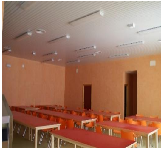
Centro de estancia diurna Belmez

Este territorio también es beneficiario de otras ayudas otorgadas por la Administración General del Estado. El Ministerio de Industria, Comercio y Turismo (MICOTUR), a través de los Planes de sostenibilidad turística en destino , concedió 3M€ a la Mancomunidad del Valle del Guadiato y otros 3M€ a la Mancomunidad de Sierra Morena Cordobesa .