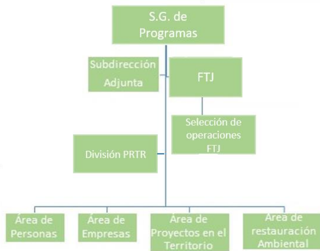
Ilustración 3. Estructura de la S.G. de Programas