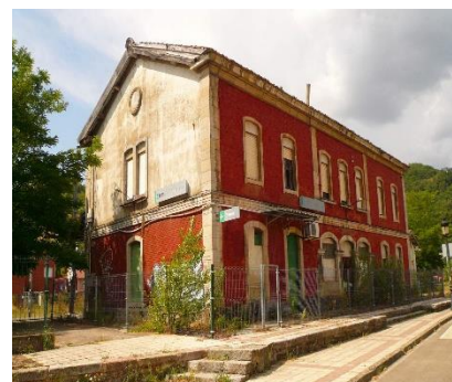
La Pola de Gordón

Rehabilitación estación ferroviaria de La Pola de Gordón para albergue de peregrinos en el Camino de Santiago