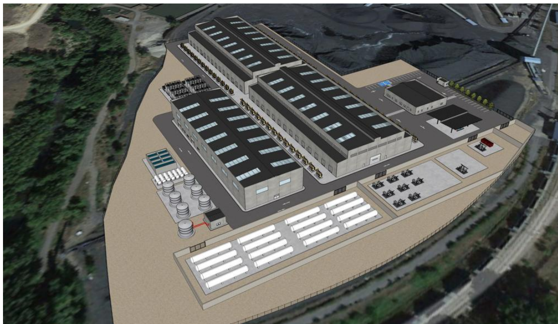
(Imagen simulación futura planta de hidrógeno de La Robla.)

La instalación suministrará hidrógeno a Arcelor y Fertiberia, dos de las industrias más relevantes de Asturias.