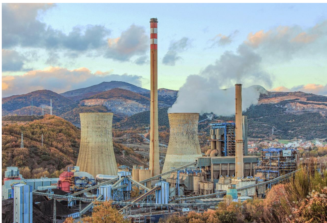
(Imagen de la Central Térmica de La Robla. Fuente: AEG Power Solutions)

Todos los cierres combinados tienen un impacto sobre el empleo de 300 trabajadores entre directos y auxiliares y sobre la actividad de 11 municipios que ya habían sufrido cierres mineros previos.