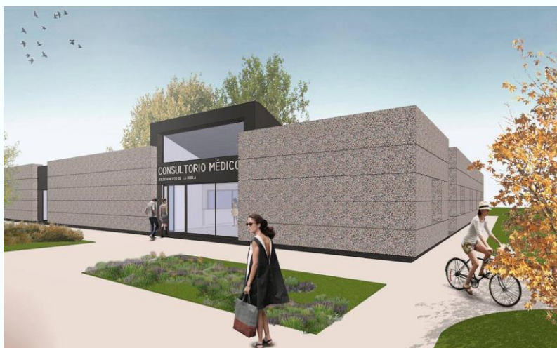
(Recreación consultorio médico de La Robla. Fuente: Leonoticias)

Por otro lado, también mediante distintas líneas puestas en marcha por el Instituto para la Diversificación y el Ahorro de Energía del Ministerio para la Transición Ecológica y el Reto Demográfico, se rehabilitará el alumbrado exterior del municipio de Sabero .