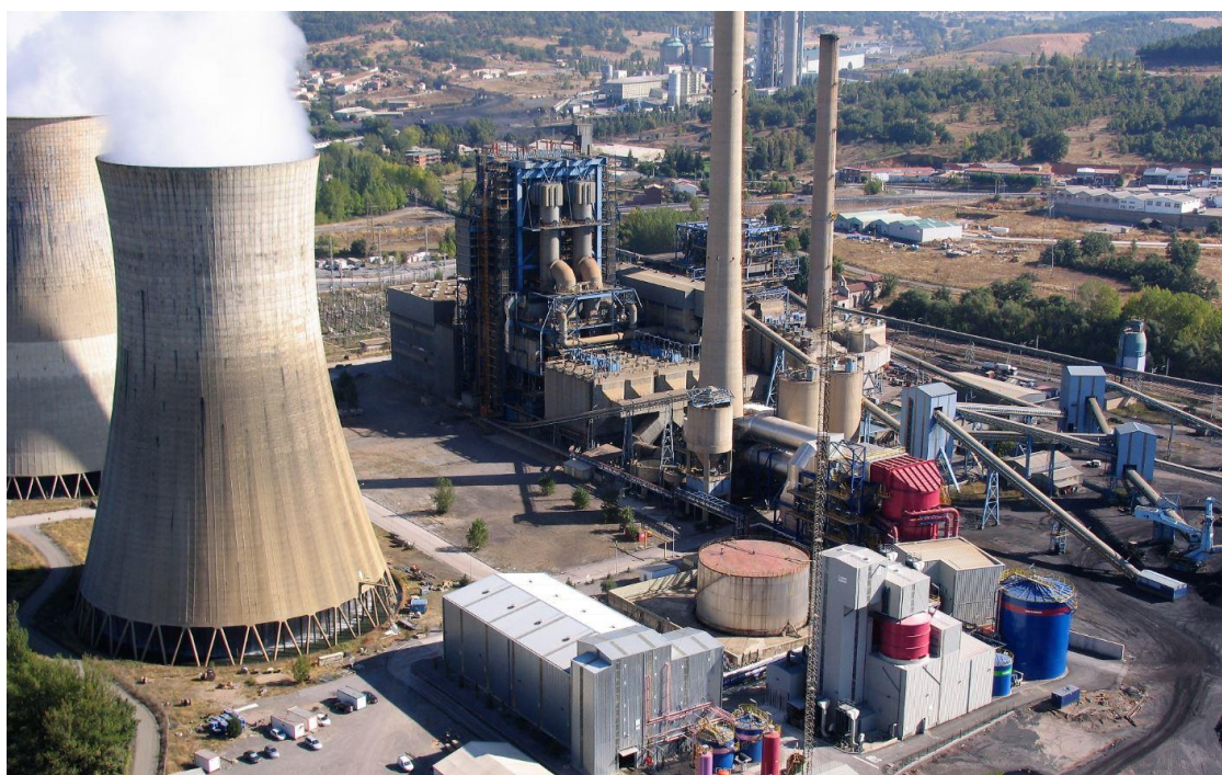
(Imagen central térmica de La Robla. Fuente: Grupo Cobra)

En este caso es la empresa la que tiene que ofrecer empleos en desmantelamiento y formación a los trabajadores que se inscriban en la bolsa de empleo, fundamentalmente auxiliares. Naturgy ha ofrecido formación al 100% de los inscritos en la bolsa de trabajo del ITJ, y al 64% oferta de empleo en el desmantelamiento.