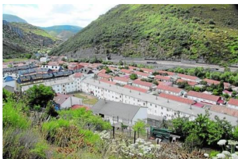
La Pola de Gordón

Recuperación social y ambiental de equipamientos deportivos y socioculturales en Ciñera