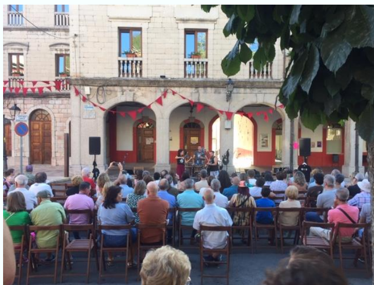
(Imagen de la actuación del grupo Lugh Música Celta en Cistierna)

En el caso de los municipios pertenecientes al presente Convenio, en 2023 está previsto que se celebren 37 actuaciones artísticas en 5 municipios