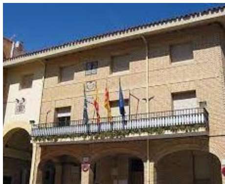
Espacio Coworking Norte Teruel, La Puebla de Híjar