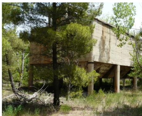
Caminos Mineros, Comarca Andorra Sierra de Arcos