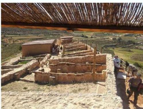
Centro íbero El Cabo, Andorra

Las infraestructuras destinadas al turismo y la cultura también tienen cabida en estas iniciativas con propuestas diversas.