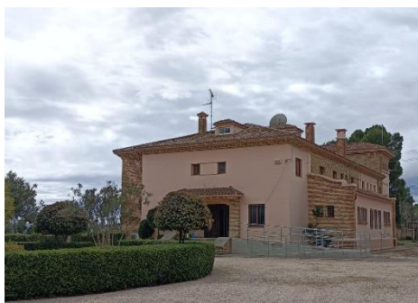
Rehabilitación edificio Atrapasueños para espacio joven, Escatrón