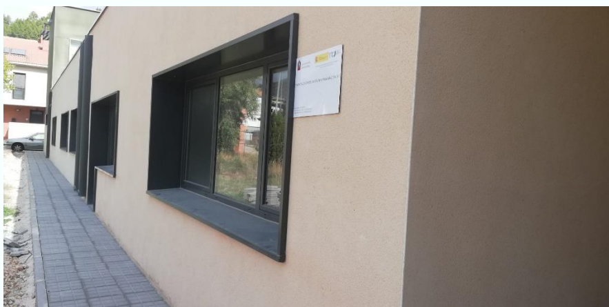
Imagen de la fachada del centro de día de Montalbán

El último sector que se beneficia de esta línea de ayudas es el socio sanitario con una ampliación de la residencia de mayores en Albalate del Arzobispo y la construcción de un centro de día en Montalbán.