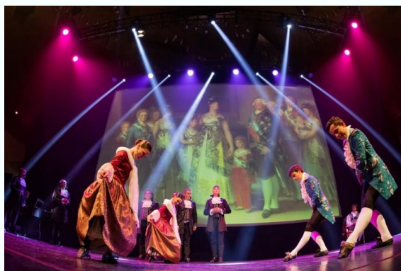
Espectáculo 'Las voces de Goya' de B Vocal. Acto de lanzamiento en Andorra, octubre 2023.

Teatro, espectáculos infantiles, danza, poesía, música clásica, celta, rock, canción reivindicativa, actuaciones infantiles, talleres, exposiciones... Una amalgama de expresión cultural, protagonizada en la ZTJ de Aragón por 52 grupos o artistas diferentes, apoyados por esta plataforma en el comienzo de sus carreras y teniendo como escenario espacios característicos de encuentro y ocio de cada una de las localidades.