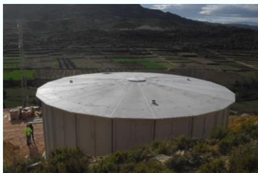
Instalación y construcción de un depósito de agua en Foz Calanda

Actuaciones del ciclo del agua , para renovación del acceso o mejora del almacenamiento.