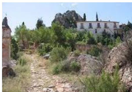
Rehabilitación refugio rural, Berge