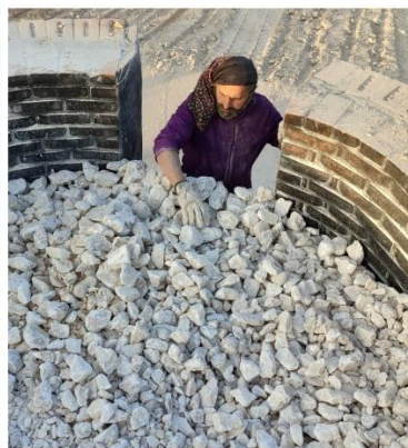
Nohuki, Albalate del Arzobispo

El sector de la agroalimentación también ha sido apoyado con iniciativas que parten desde entidades cooperativas, como La Calandina, especializada en envasado de melocotón y elaboración de aceite de oliva del Bajo Aragón; como la desarrollada por dos jóvenes de Andorra, que crearon la primera planta de secado de pistacho en Aragón . La industria cárnica de porcino es una de las más significativas en la zona y esta ayuda permitió a Cárnicas Ortín su crecimiento, pudiendo instalarse en una nave industrial, ampliando producción y personal.