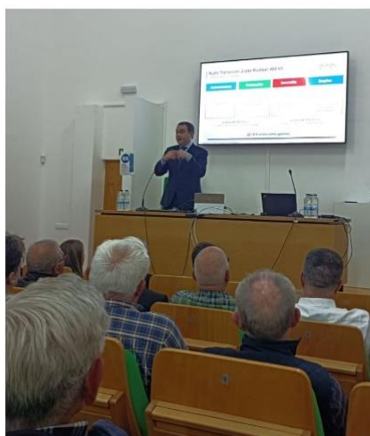
Acto de presentación. Marzo de 2023

Escuela rural de energía sostenible . La formación laboral está orientada a las renovables y agricultura ecológica. Se impartirán 337.650 horas para 1.300 participantes.