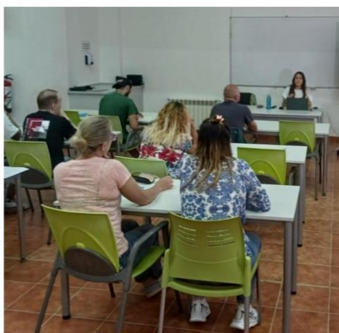
Primeros cursos. Junio de 2023