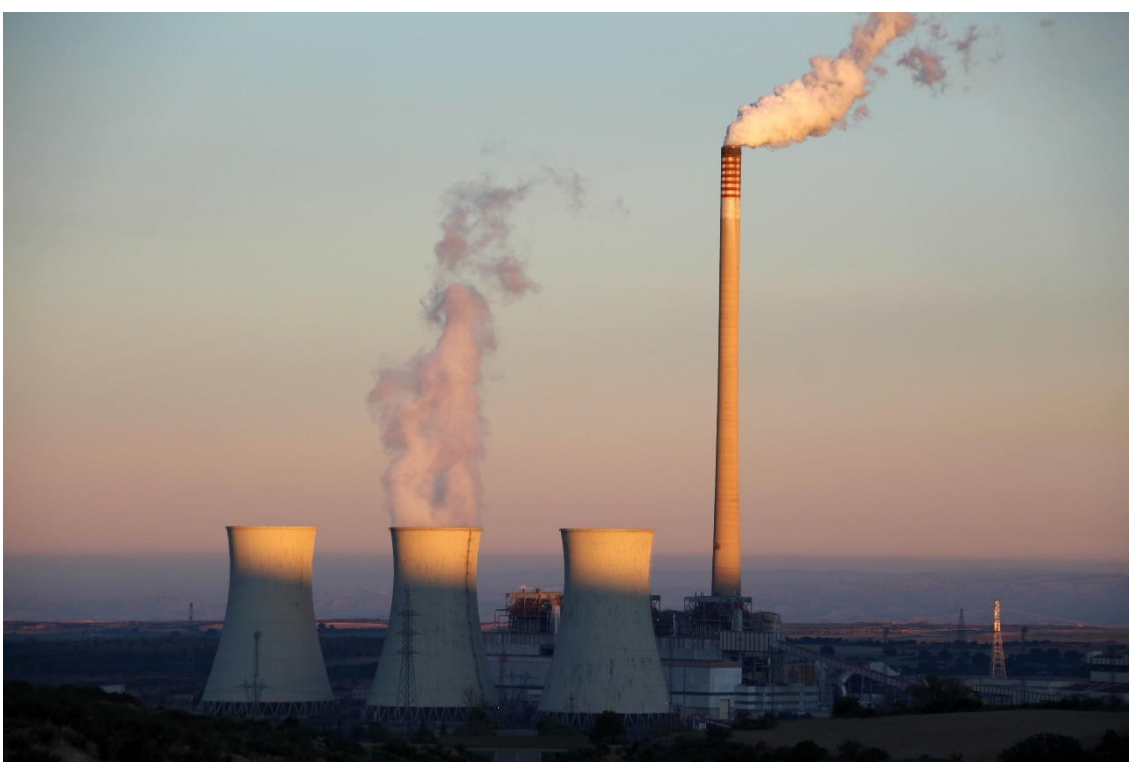
Imagen de la Central Térmica Teruel en Andorra.

Todos los cierres combinados tienen un impacto sobre el empleo de 532 trabajadores entre directos y auxiliares y sobre la actividad de 34 municipios que ya habían sufrido cierres mineros previos.